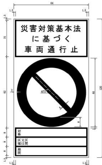
別記様式第2（第5条関係）