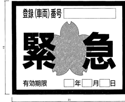
別記様式第7(第6条の2関係)